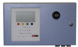
BL Mifare RFID olvasóval Mifare technológia