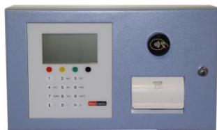
BL Card mágnes kártya olvasóval

A Heconomy BL család három különböző típusból áll össze, melyekbe az összes szükséges opció adaptálva lett a korábbi verziókból.